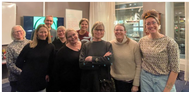
Styrelse och kansli på verksamhetsdagen: