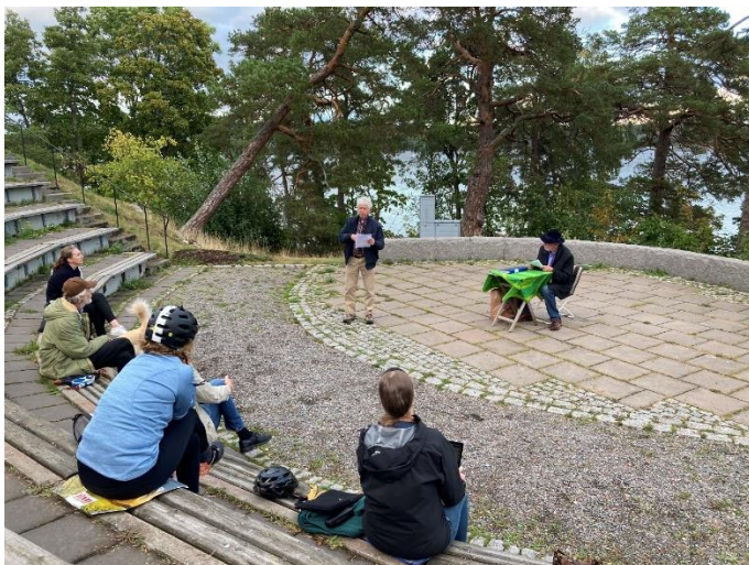
Saltsjöbadens årsmöte 9 september 2020 hölls utomhus.

Året präglades av uppskjutna årsmöten på grund av att covid-19 förhindrade kretsarna från fysiska möten. En sammanställning av årsmöten gjordes och visade att 23 av 25 kretsar höll sina årsmöten 2020. 20 januari 2021 höll ytterligare en krets sitt årsmöte och en sista krets valde att inte hålla årsmöte 2020 utan håller kombinerat möte våren 2021. Riks tillät kretsarna att under omständigheterna skjuta upp sina årsmöten. Återbäring betalades ut när handlingarna från årsmötet skickades in.