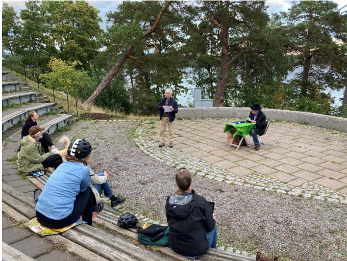
Saltsjöbadens årsmöte 9 september 2020 hölls utomhus.