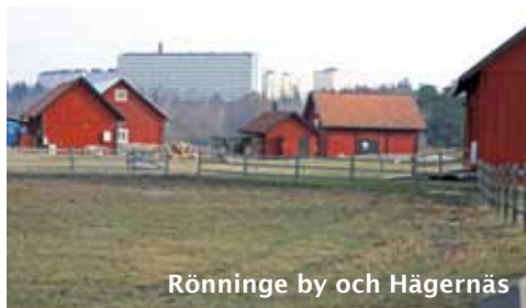
Rönninge by och Hägernäs