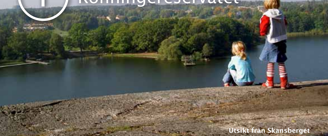
Utsikt från Skansberget

Naturreservatet Rönninge by och Skavlöten ligger utmed Rönningesjöns östra strand och är kommunens viktigaste friluftsområde. Här kan du vandra längs många olika leder och spår. I norra delen av området finns tät barrskog. I södra delen av området ligger 1800-talsbyn Rönninge by. Ungefär i mitten av strandsträckan ligger Skansberget. Härifrån har du en fin utsikt över såväl sjön som andra delar av Täby.