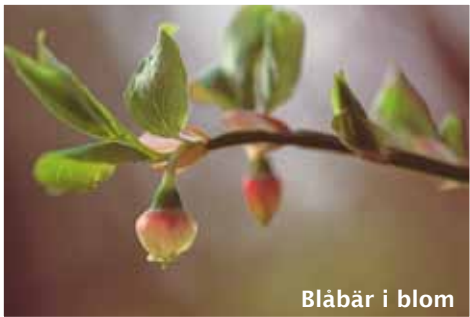
Blåbär i blom

Runt Svindersviken finns flera spännande och vackra naturområden, mitt bland bebyggelse och motorvägar. Hela detta område utgör den innersta delen av Nacka-Värmdö-kilen och erbjuder ett dramatiskt landskap med fantastiska utsikter över inloppet till Stockholm.