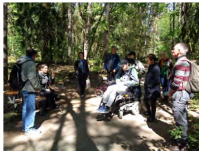
Guidning i Judarskogen