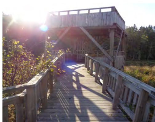
Skutans fågeltorn, anp. för rörelsesnedsättning, Haninge