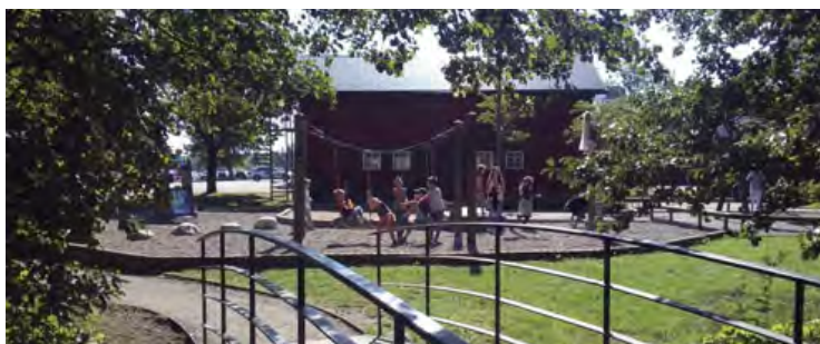
Plats för lek i härlig miljö, Tungelsta trädgårdspark, Haninge