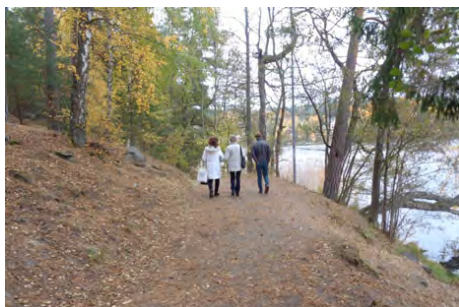
Garnuddens naturreservat, Salems kommun