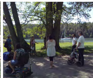
Guidning i Tyresö slottspark